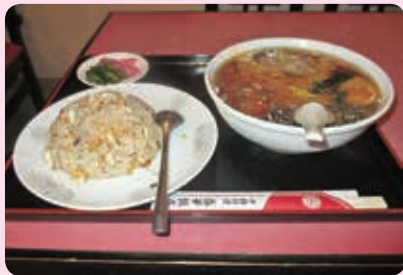
半チャーハンとラーメンセット(¥860)