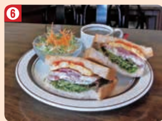
6 コーヒー工房 黒柳 (本庄支店)