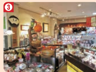
3 梅月堂 (本店)