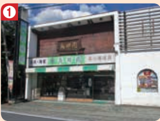
1 島田園 (本店)