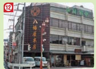
12 八幡屋 本店 (秩父支店)