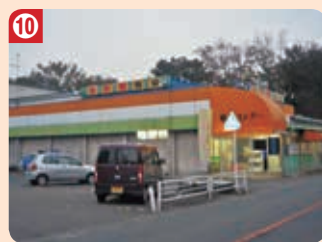
10 魚栄ストア (上里支店)