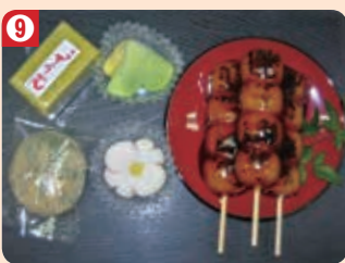
9 塚越製菓店 (上里支店)