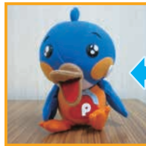
ピッピくん 「ぬいぐるみ」