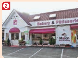
2 パンとお菓子のお店 マロン (本店)