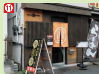
11 ラーメン 籠 (おぼろ) (秩父支店)