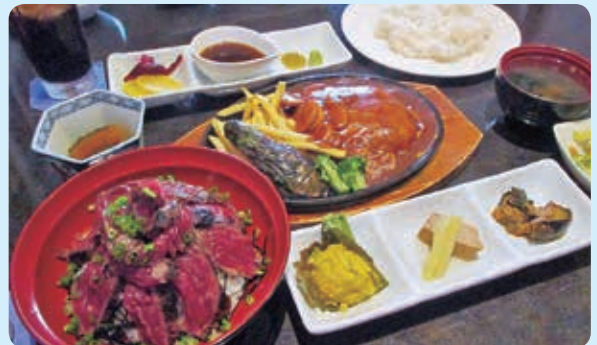
ローストビーフ丼 ¥1,380 ハンバーグセット ¥1,080

《オーナーより》他にパスタ、ハンバーグ、焼き魚、タコ ライスがございます。昼・夜 宴会も受け賜わっておりま す。10名様以上はマイクロバス、大型バスによる送迎が できますので、ぜひご利用くださいませ。