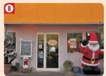
8 パワールの木 (上里支店)