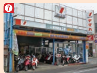
7 オートショップ たけうち (本庄支店)