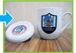
ピッピくん 「マグカップ」