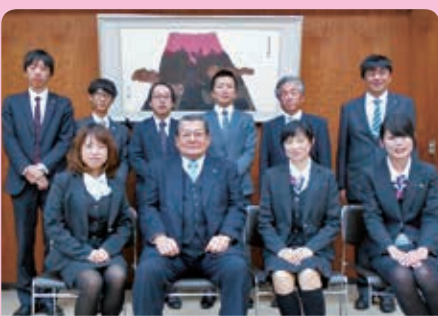
● 理事長と編集委員メンバー

【埼玉信用組合 本部(営業統轄部) 0495-72-3511】 フリーダイヤル 0120-097-874