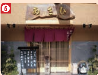
5 あさひ鮎 (本庄支店)