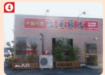
4 盛華飯店 (本店)